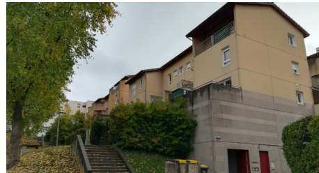
Galerie Pierre de Boissat