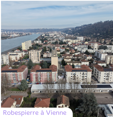
Robespierre à Vienne

En décembre dernier, le Conseil d'administration de l'Office a voté le budget pour l'année 2026. Advivo continue d'investir pour améliorer votre quotidien.