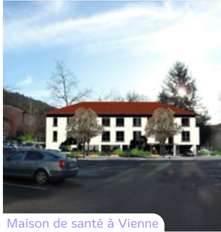
Maison de santé à Vienne