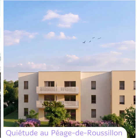
Quiétude au Péage-de-Roussillon

En 2026, 25,2 millions d'euros seront consacrés à l'entretien, à la rénovation et à l'amélioration de notre parc immobilier.